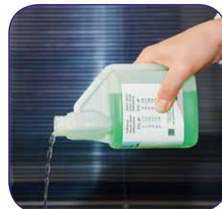
Empty calibration compartment