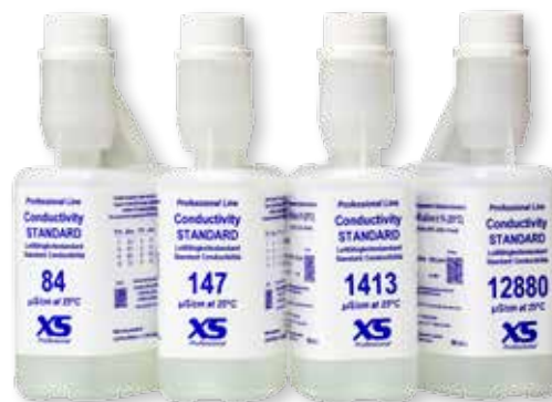
With DANAK/DFM certificate