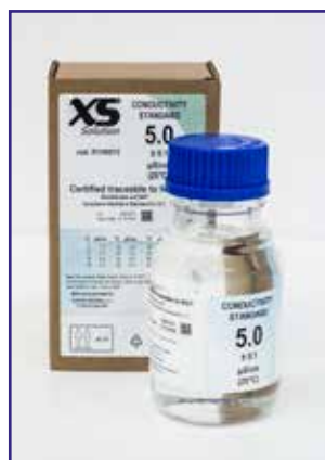
Conductivity standard 5 \mu\text{S}/\text{cm} with NIST traceability