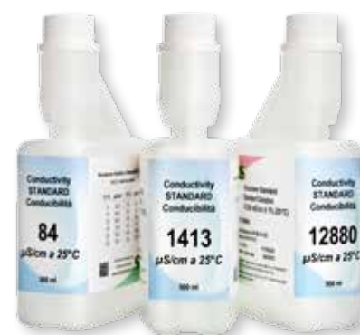
With NIST traceability