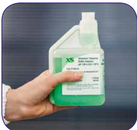
Fill calibration compartment