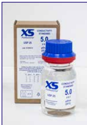
Conductivity standard 5 \mu\text{S}/\text{cm} with DANAK/DFM certificate