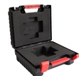
Valise plastique Plastic case